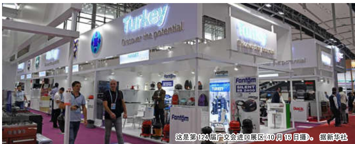
这是第124届广交会进口展区(10月15日摄)。

背后,是中国经济近年来持续稳健的表现以及经济升级迭代的广阔前景,也是今年以来中国对外贸易稳中向好的积极态势。