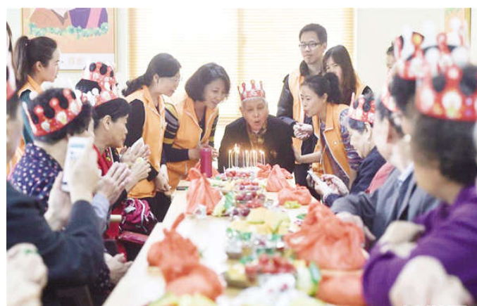
在福州市台江区福机新苑居家照料中心，老人们在过集体生日(4月15日摄)。

会议指出，打好污染防治攻坚战，要使主要污染物排放总量大幅减少，生态环境质量总体改善，重点是打赢蓝天保卫战，调整产业结构，淘汰落后产能，调整能源结构，加大节能力度和考核，