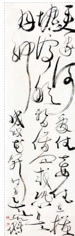
吴东魁最新书法作品