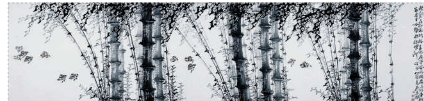
新竹高于旧竹枝,全凭老竿来扶持