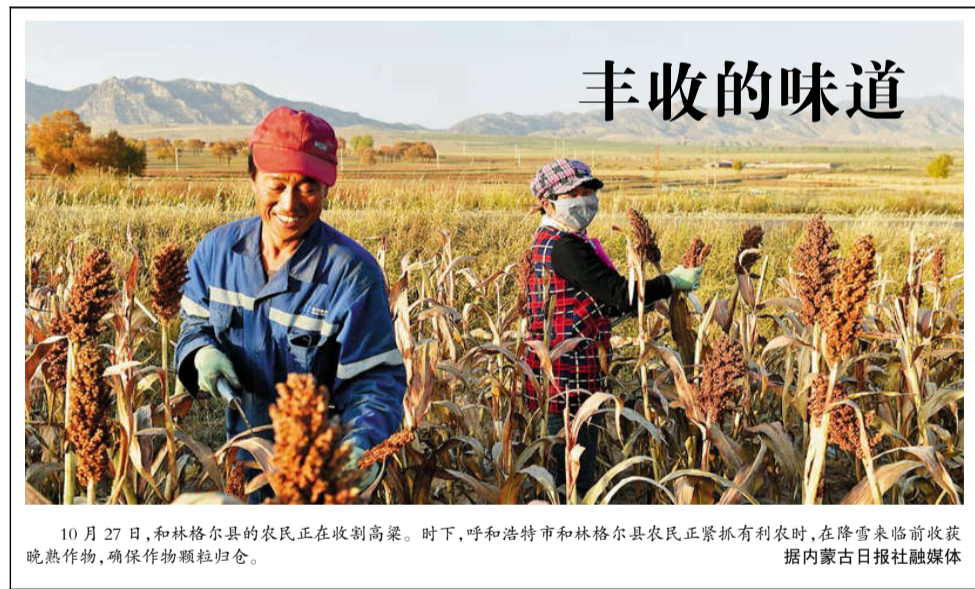
10月27日，和林格尔县的农民正在收割高粱。时下，呼和浩特市和林格尔县农民正抢抓有利农时，在降雪来临前收获晚熟作物，确保作物颗粒归仓。