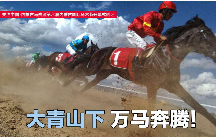
关注中国·内蒙古马赛暨第六届内蒙古国际马术节开幕式侧记