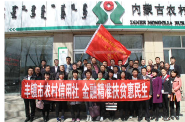
2016年4月,组织帮扶干部深入精准扶贫帮扶联系点丰镇市官屯堡乡獐子窝村,进村入户了解贫困户庄稼收割情况,并为贫困户送上金融知识和扶贫政策“大礼包”。