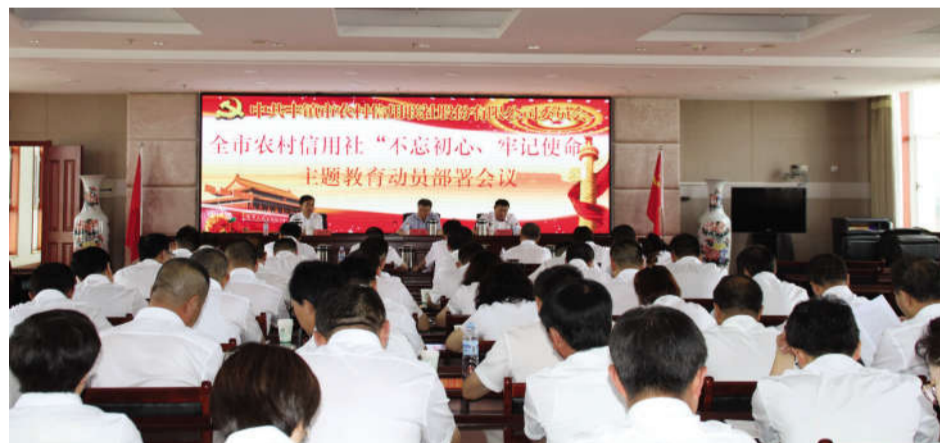
2019年6月19日 组织全辖党员干部召开“不忘初心,牢记使命”主题教育动员部署会议