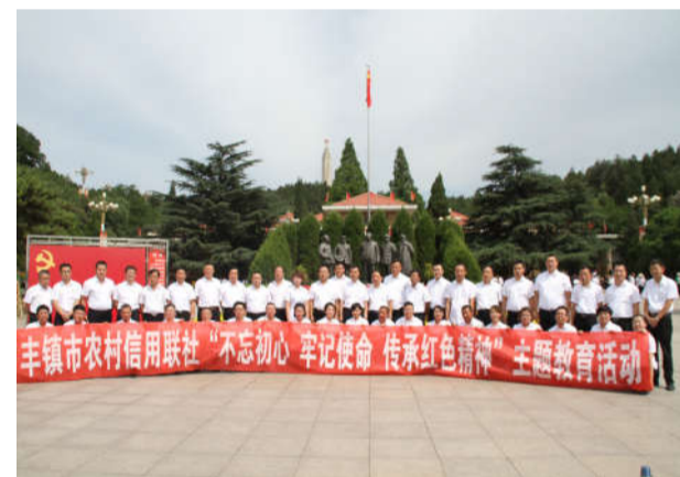
2018年七一前夕,组织党员干部、预备党员、入党积极分子和优秀共青团员等46人,前往革命圣地西柏坡参观学习,“重温西柏坡精神”,号召全体党员干部员工继承发扬老一辈革命家优良传统,不忘初心,牢记使命,学习好、宣传好、贯彻好习近平新时代中国特色社会主义思想,为丰镇市联社转型升级发展继续贡献智慧和力量!