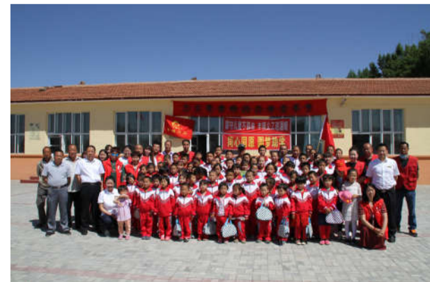
2017年6月1日赴三义泉学校开展“同心同德·圆梦助学”爱心捐赠公益活动,为58名学生送去书籍、彩笔、足球等学习用品,帮助他们实现微愿望。