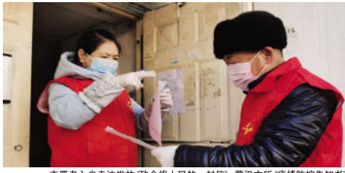
志愿者入户走访发放《致全旗人民的一封信》、蒙汉文版《疫情防控告知书》

他们是身披红色铠甲的战士，他们是疫情防控中逆行的勇者，晨曦中、暮夜里，总能看见他们的身影，您在守护着家，他们在守护着您。 为了齐心协力打赢疫情防控的人民战争、总体战、阻击战，兴安盟科右中旗新时代文明实践中心第一时间吹响志愿服务集结号，发起疫情防控的总动员，全旗13个文明实践所、196个文明实践站迅速响应，组建了80支三级三类疫情防控志愿服务队。截至目前，共有5000余名文明实践志愿者参与防控宣传、疫情排查、卫生整治、物资捐赠、便民服务、心理疏导六个方面的志愿服务。