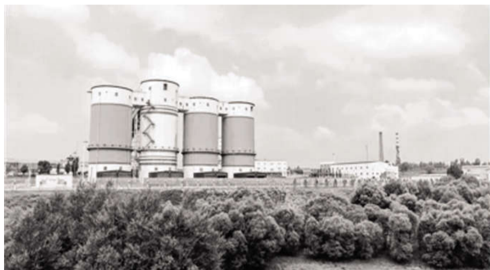
内蒙古自治区全面整治煤炭资源领域违法违规问题,全面净化政治生态,以生态优先、绿色发展为导向的高质量发展新路子。图为伊金霍洛旗蒙泰来梁煤矿按照绿色发展理念推动清洁生产,厂区面貌焕然一新。

视巡察,对鄂尔多斯等7个涉煤重点盟市、自然资源局等4个涉煤厅局、包钢集团等3家涉煤国企开展煤炭资源领域违法违规问题专项巡视;鄂尔多斯等7个盟市同步对43个县(市、区、旗)279家涉煤部门、单位、乡镇(苏木)和国有企业开展专项巡察,共发现涉煤领域问题2106个。各巡视巡察组坚持边巡边改、边巡边查,对反映具体、可查性强的问题线索快速处置,对事实清楚、责任明确的突出问题及时移交,督促立行立改、边整边改。