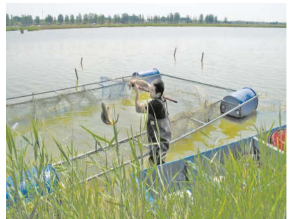
一棵树村的湿地是养殖鱼虾的“乐土”。