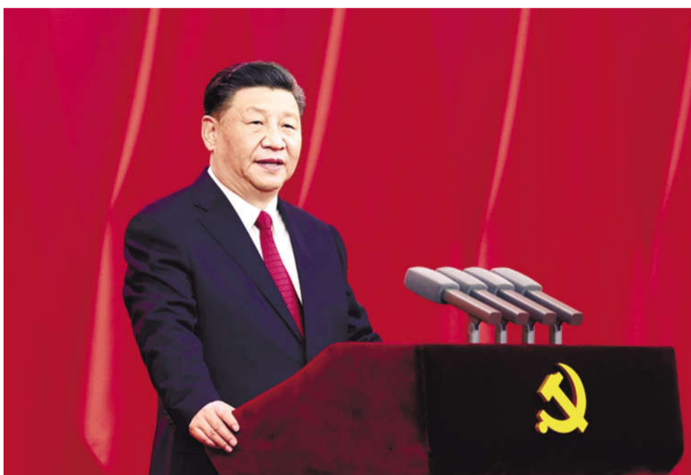
6月29日，庆祝中国共产党成立100周年“七一勋章”颁授仪式在北京人民大会堂金色大厅隆重举行。中共中央总书记、国家主席、中央军委主席习近平向“七一勋章”获得者颁授勋章并发表重要讲话。