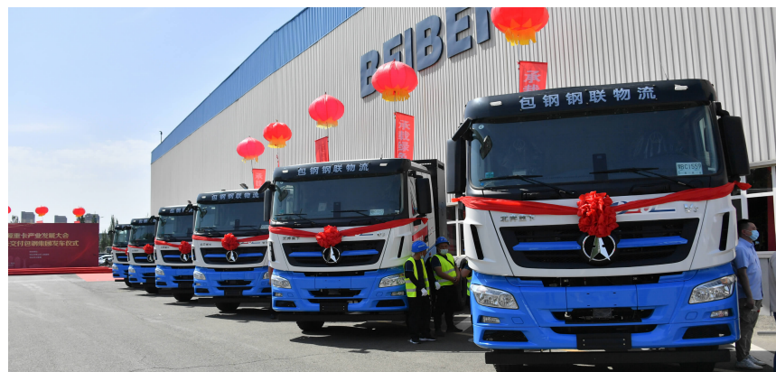
北奔重汽新能源重卡

今年以来,赤峰市市场监管系统共办理食品药品、产品质量、广告宣传等各类罚案件67件。