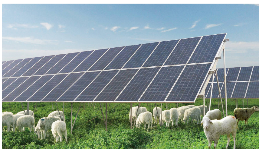
锡林郭勒盟光伏产业实现跨越式发展

2018年9月18日22时,蒙能锡林浩特电厂3号机组一次并网成功,成为锡林郭勒盟至山东1000千伏特高压交流输电通道首个并网调试的电源项目,锡林郭勒盟清洁能源输出基地建设