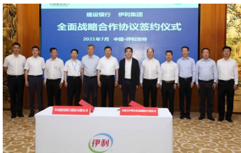
2021年7月伊利与建行全面战略合作协议签约仪式现场

建设银行总行党委高度重视对奶业振兴的金融支持成效,指出奶业振兴是实施乡村振兴战略、促进