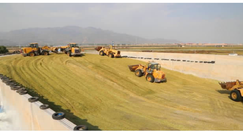
加紧作业制作青贮