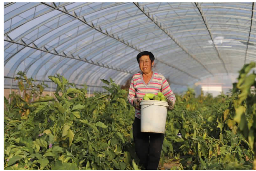
突泉县易地搬迁小区种植基地的大棚茄子大量上市

“大家加把劲,再装一车,超市等着卖咱们的白菜呢。”一大早,内蒙古自治区兴安盟突泉县易地扶贫搬迁安置点醴泉小区扶贫就业基地的设施大棚内热闹非凡。