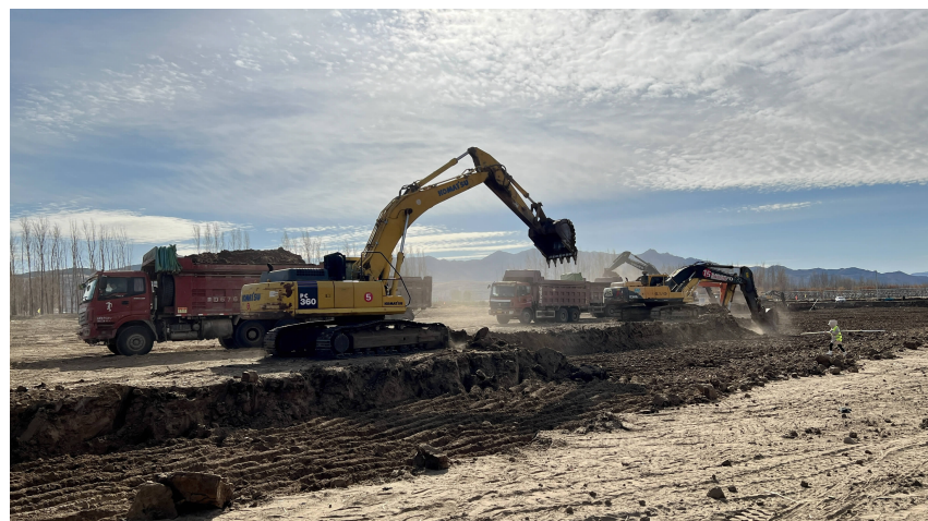
赤峰宏福现代产业园项目施工现场

击鼓催征,奋楫扬帆。九原区将继续坚持以习近平新时代中国特色社会主义思想为指导,深入贯彻党的二十大精神,秉持“拼”的精神、“闯”的劲头、“干”的作风,迈开步子“爱包头、作贡献”,进一步优化招商服务,强化招商引资举措,创新招商方式,营造浓厚招商氛围,奋力开启现代化中心城区建设新征程,为推动包头经济高质量发展、再创业头辉煌贡献九原力量。 王佳妮