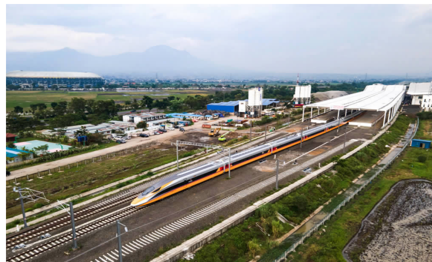
11月16日,在印度尼西亚万隆,高速铁路综合检测车行驶在雅万高铁试验段(无人机照片)。

加强督导检查,实现安全运营。为保证市场主体安全稳定运行,针对连锁超市、生鲜便利店建立了局领导包联市四区+超市点位常态化督导机制,印发《大型连锁超市疫情防控管理规范》《疫情期间商场、超市预防性消毒指南》,督促市场主体严格落实人员闭环、无接触配送、环境消杀等疫情防控措施,发现问题要求企业立行立改,对衔接不顺畅、管理不到位的市场主体进行约谈。