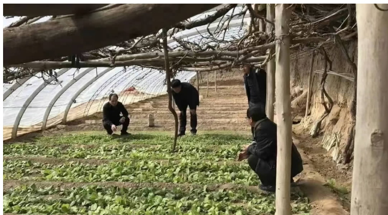
党员干部专题调研设施农业建设情况