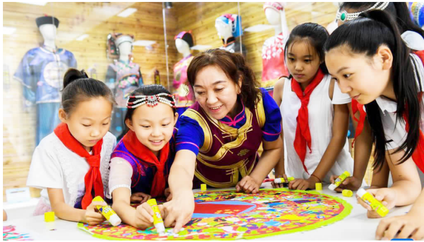
2019年7月15日拍摄于赤峰市松山区兴安街道临潢家园

清晨,当第一缕阳光照射在内蒙古自治区最东端的大兴安岭,最西端的额济纳胡杨林还在沉睡。边境线绵延4200多公里的内蒙古自治区,守望祖国北疆,犹如昂首奔腾的骏马。 对于这片美丽辽阔的土地,习近平总书记始终深情牵挂。党的十八大以来,总书记先后两次深入内蒙古考察调研,连续五年参加全国人大内蒙古代表团审议,为内蒙古的发展擘画蓝图、明确路径。内蒙古各族干部群众落实总书记嘱托,开拓进取、奋发有为,各项事业蒸蒸日上。