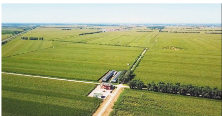
金秋时节,处处生机盎然,一派乡村田园迷人风景,一幅乡村振兴的生动画卷在科尔沁大地徐徐展开。