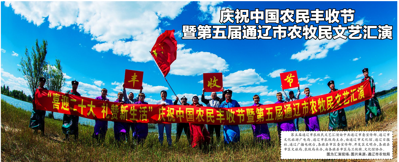
第五届通辽市农牧民文艺汇演由中共通辽市委宣传部、通辽市文化旅游广电局、通辽市农牧局主办,由通辽市文化馆、通辽日报社、通辽广播电视台、各旗县市区委宣传部、开发区文明办、各旗县市区文旅局、农牧局承办,由各旗县市区乌兰牧骑、文化馆协办。 图为汇演现场,图片来源:通辽市农牧局