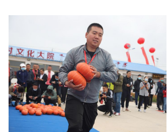
文中配图为2022年“中国农民丰收节”内蒙古自治区主会场活动现场