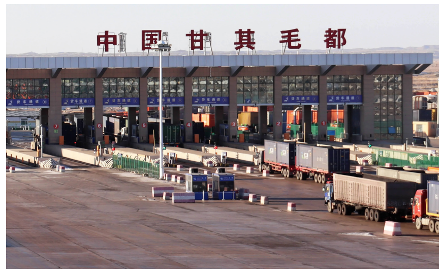
内蒙古甘其毛都口岸正在通关

值得一提的是,为确保节日市场安全有序,自治区商务厅印发了《关于做好2023年元旦、春节期间生活必需品市场保供工作的通知》,启动了生活必需品日报制度,加强与产销对接,拓宽货源渠道,增加市场供给。