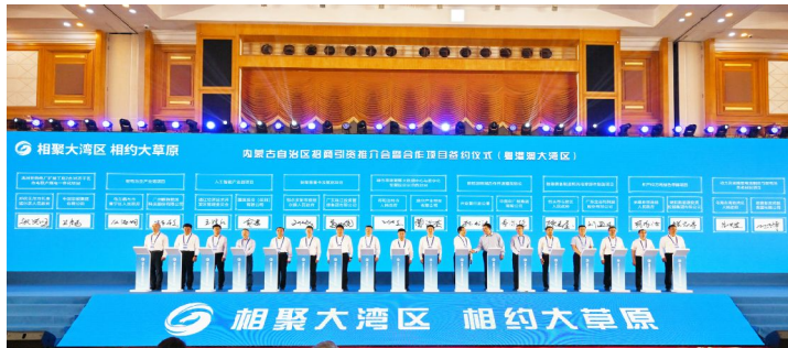
推介会合作项目签约仪式