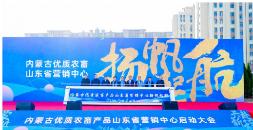
内蒙古优质农畜产品山东省营销中心启动