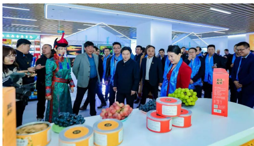
参观内蒙古优质农畜产品山东省营销中心