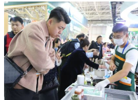
高品质农特产品吸人眼球