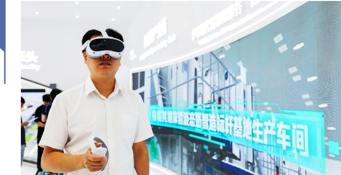
在奶业全产业链上市体验VR