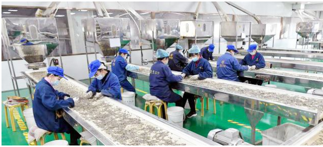
工人在筛选葵花籽

“与此前坐庄门吃瓜子炒豆,不知如复何日否?”《苏武集》中,东坡先生曾在给友人的信里,提及自己向往的生活。