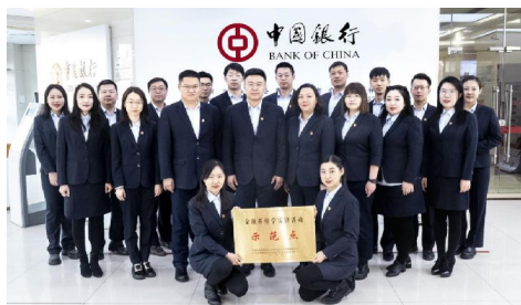
荣获“金融系统学雷锋活动示范点”称号

雷锋精神是中华优秀传统文化、革命文化和社会主义先进文化的有机结合，是一面永不褪色、永放光芒的旗帜，是推动事业前进的强大精神动力。2022年11月，中国金融思想政治工作研究会传承雷锋精神委员会与中华志愿者协会传承雷锋精神志愿者委员会在金融系统开展学雷锋活动示范点和学雷锋模范的认定命名工作。中国银行呼和浩特市新城支行获评“金融系统学雷锋活动示范点”称号，全国金融系统内共133家机构获评此荣誉，中国银行呼和浩特市新城支行是内蒙古地区银行系统内唯一一家上榜机构。