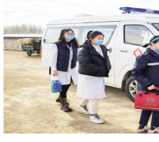
参加爱心义诊人员进村