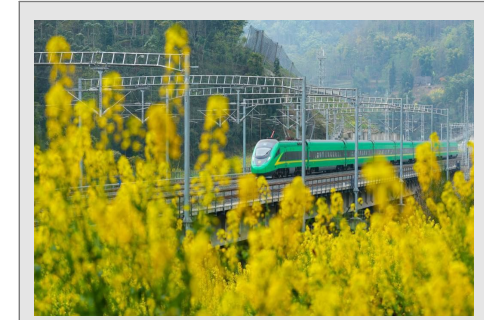
春天里的列车 3月10日,复兴号动车组列车在成渝昆铁路上,铁路附近的油菜花吐露芬芳。

广大党员干部群众纷纷表示,在以习近平同志为核心的党中央坚强领导下,踔厉奋发、勇毅前行,保持在新征程上赢得更加伟大的胜利和荣光!