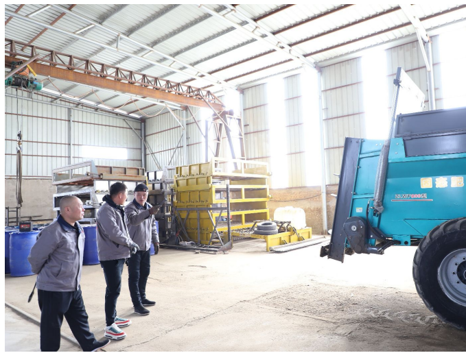
▲服务站的农机手们调试检修有机肥撒播设备。