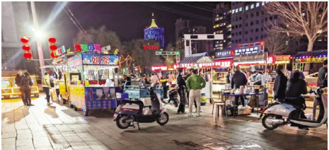
突泉县新城步行街夜市

突泉县陆续开放早市、夜市6个,可容纳900余个摊位,积极打造消费新场景,为促进就业、拉动消费、助力经济增长,改善民生提供有力支撑。助力新城市启动以来,以烧烤、美食等业态为主,每日客流量达5000人,日均销售额达8万余元。(丁亚楠)