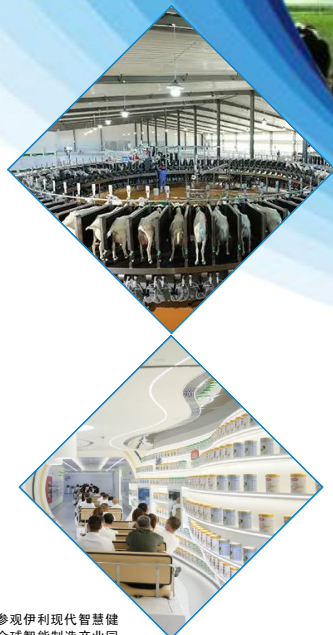
参观伊利现代智慧健康谷全球智能制造产业园内的产品展示区

草原都市生机蓬勃,奶业振兴正当其时。“中国乳都”呼和浩特扛牢奶业振兴责任担当,在发展千亿级奶产业进程中,形成了种好草、育好种、养好牛、产好奶、建好链的“从一棵草到一杯奶”全产业链条,推动“中国乳都”向“世界乳都”迈进。