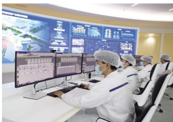
伊利现代智慧健康谷控制中心

推动首府奶业振兴,要在“育好种”上下功夫,造好奶业发展的“芯片”,让首府的牛真正“牛”起来。在内蒙古草种业技术创新中心实验室,科研人员正在对羊草、紫花苜蓿等重要草种进行收集筛选。“我