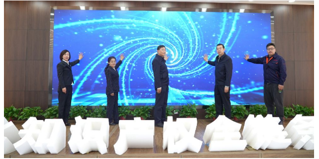
▲内蒙古自治区知识产权保护中心“一站式”服务平台正式启动

强化职能整合与系统融合, 聚焦市场监管主责, 充分发挥贴近经营主体的天然优势、质量服务的优势, 释放乘数效应 ——