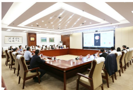
▲自治区市场监管局组织开展市场准入环节“处长走流程”活动