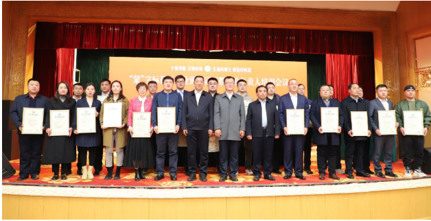
▲内蒙古自治区“蒙”字标获证企业证书颁发现场