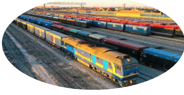
二连浩特铁路口岸中欧班列整装待发