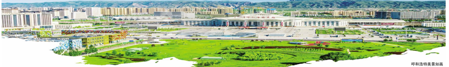
呼和浩特美景如画