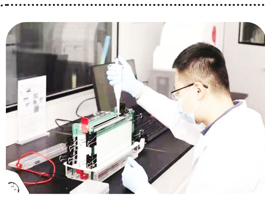
蒙分子育种实验室科研人员正在开展燕麦品种指纹图谱实验,进行燕麦 SSR 分子标记 PCR 产物检测,根据检测结果判定燕麦品种。(林长青)

6月27日,由2023中国国际康养产业发展高峰论坛乌兰察布峰会参会人员组成的观摩团深入乌兰察布市,就康养项目进行观摩考察,加强交流对接。观摩团先后来到平地泉镇区域养老服务中心、乌兰美·观逸堂、博慈老年养生公寓、溪林湾智慧康养社区等地,对运营管理、模式创新、居住环境、配套设施、人文关怀、医养深度融合等方面工作进行深入了解。大家一致认为,乌兰察布市基本养老服务体系建设工作思路清晰,措施到位,成效明显。希望以此峰会为契机,进一步加强与乌兰察布市的沟通交流,加大各方文旅资源互相推介力度,共同开发生态文旅、健康养生等产品,不断拓展合作领域,促进康养产业高质量发展。(冀娜)