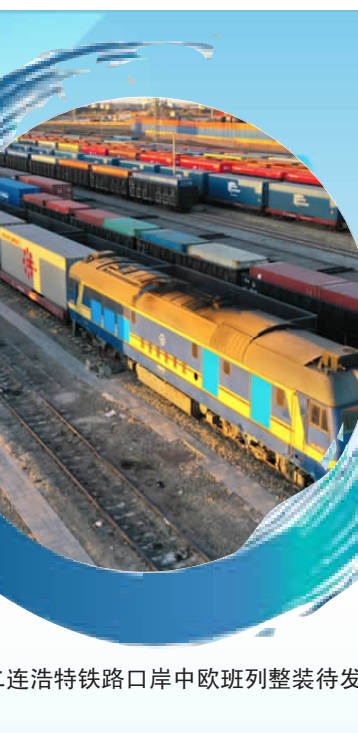
二连浩特铁路口岸中欧班列整装待发

定了坚实基础。今年以来,二连浩特铁路口岸运量屡创新高,3月15日,准轨集宁方向单日接发列车实现15对新突破;6月6日,二连至扎门乌德国境站单日交接列车、车辆创最高历史纪录(宽轨接入17列/840辆、准轨交出9列/486辆)。今年前七个月,二连浩特铁路口岸共完成进出口运量992.70万吨,同比增长46.2%。