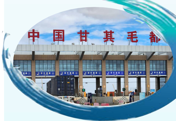
甘其毛都口岸正在通车辆

记者从内蒙古甘其毛都口岸管委会获悉,今年前7个月,作为中蒙两国间过货量最大公路口岸的甘其毛都口岸累计完成过货量1979.8万吨,同比上涨172.61%,继续领跑中蒙之间的各个口岸。