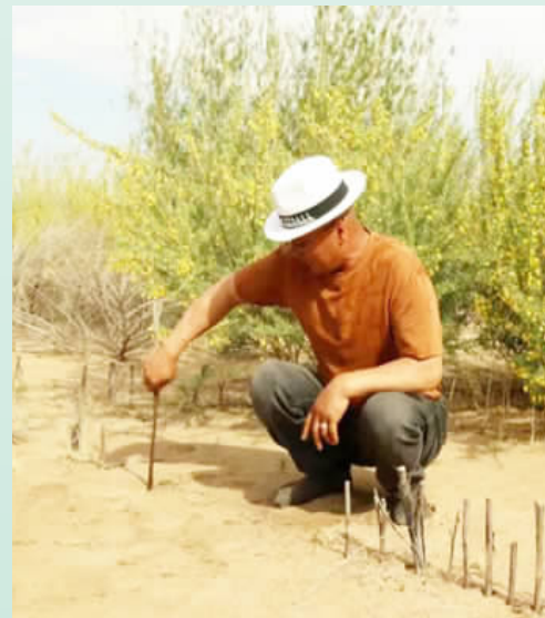
特古斯正在草场上栽设沙障