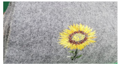
向日葵“长”在围巾上