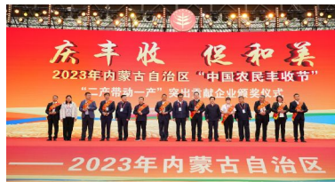
鄂尔多斯市为二产带动一产突出贡献企业颁奖