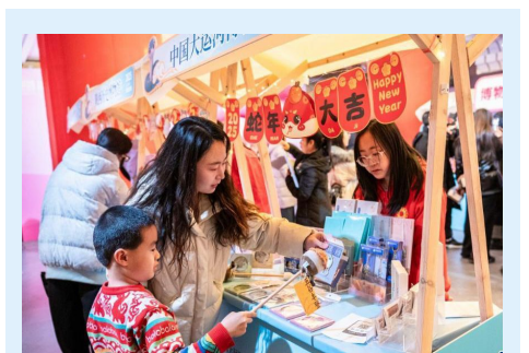
参观者选购文创产品

据了解,2018 年 1 月,华北油田获得了巴彦浩特、河套盆地 2 个探矿权,年底成立巴彦勘探开发分公司,6 年内,在河套盆地原油总产量突破 350 万吨,实现工业总产值逾 100 亿元,上缴税收超 20 亿元,为地方经济发展注入强劲动力,保障了国家能源安全。(刘筱尧 熊巧红 赵爽 王立强)