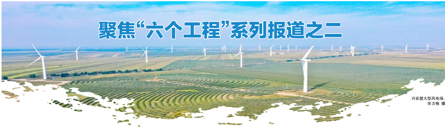
兴安盟大型风电场。