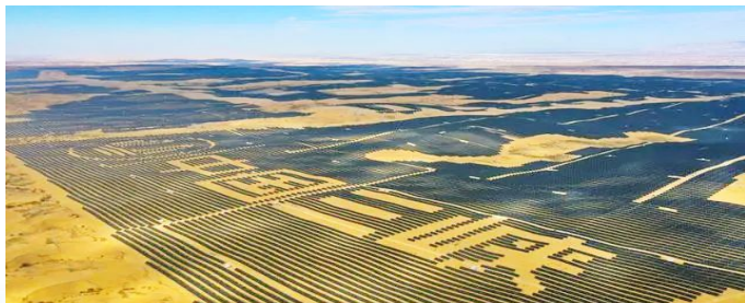
蒙西基地库布其200万千瓦光伏治沙项目成功并网。

防沙治沙和风电光伏一体化工程是实干工程,不仅需要真金白银的投入,更需要工作模式的创新,还需要尊重经济规律和市场规律,将实干、科学、智慧有机地融合在一起,才能创造出工程建设的奇迹来,才能产生“四两拨千斤”的效果。只有“防沙治沙风电光伏”一体化高质量推进,才能实现“生态优先、绿色发展”的一个个宏伟目标。