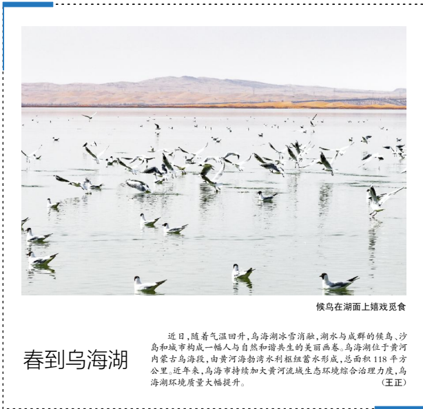
候鸟在湖面上嬉戏觅食

公路客运完成客运量和旅客周转量分别为377万人次、4.9亿人公里,同比增长36.5%和48.5%;铁路客运完成客运量和旅客周转量903.8万人次、31.9亿人公里,同比增长54.5%和41.8%;民航客运完成客运量229万人次,同比增长61%。(据《内蒙古日报》)