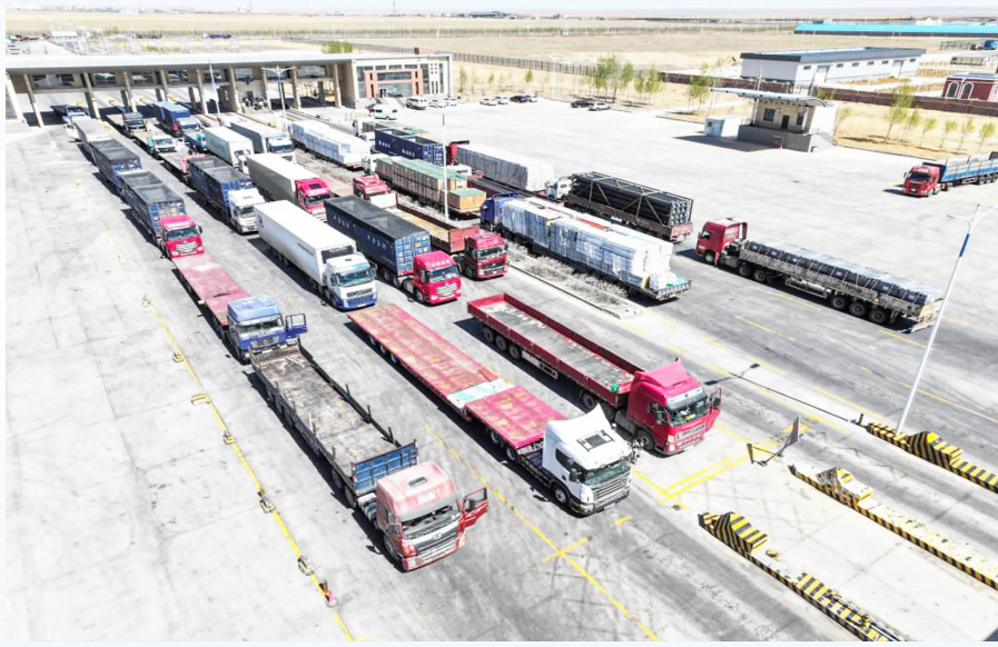
二连浩特公路口岸等待通关的车辆