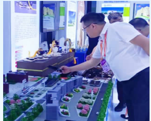
新能源应用场景展示