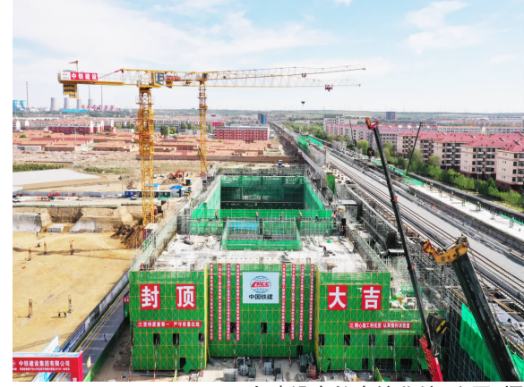
正在建设中的丰镇北站

此外,活动现场,石油和化学工业规划院、中国石油和化学工业联合会相关负责人分别作主旨演讲,就新型化工暨现代煤化工产业发展前沿技术和方向等内容进行了客观分析,为下一步内蒙古新型化工暨现代煤化工产业链延链、补链、强链指明了方向。包头市发展改革委、鄂尔多斯市发展改革委、乌海市发展改革委和阿拉善盟发展改革委有关负责人分别作盟市推介。浙江荣盛集团、包头永和新材料有限公司有关负责人作企业推介。