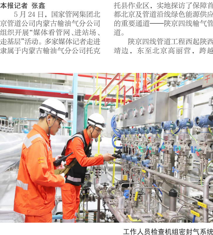
工作人员检查机组密封气系统