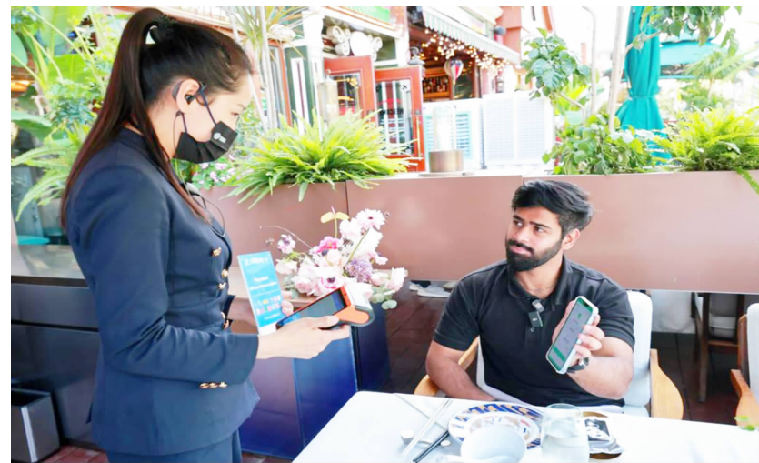
一名巴基斯坦游客在北京一家餐馆饭后进行扫码付款

在此背景下,相关部门着力打通境内外支付,一方面推动“外卡内绑”,境外银行卡可绑定支付宝或财付通在国内商户消费;另一方面支持“外包内用”,越来越多境外电子钱包可在国内