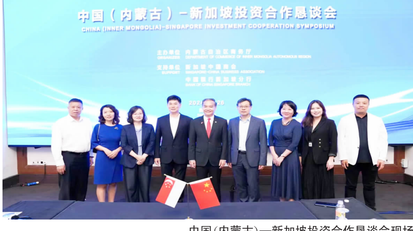
中国(内蒙古)-新加坡投资合作恳谈会现场

展潜力巨大、前景无比广阔、投资恰逢其时,愿同新加坡企业一道,深化产业投资合作,共同构建产业多元发展、互补互促的产业格局。呼和浩特市、包