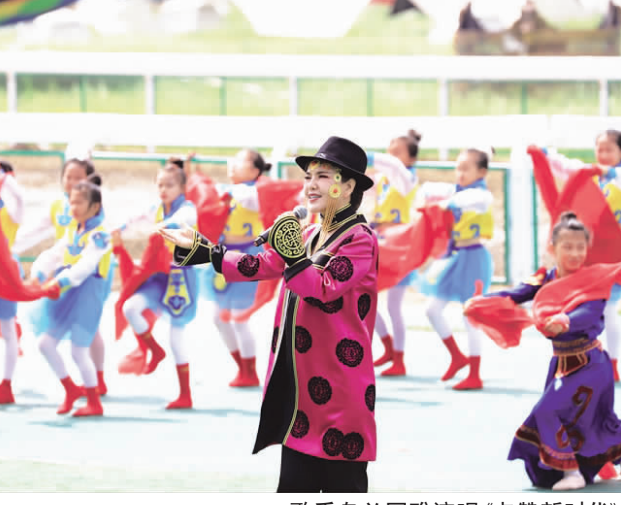
歌手乌兰图雅演唱《点赞新时代》