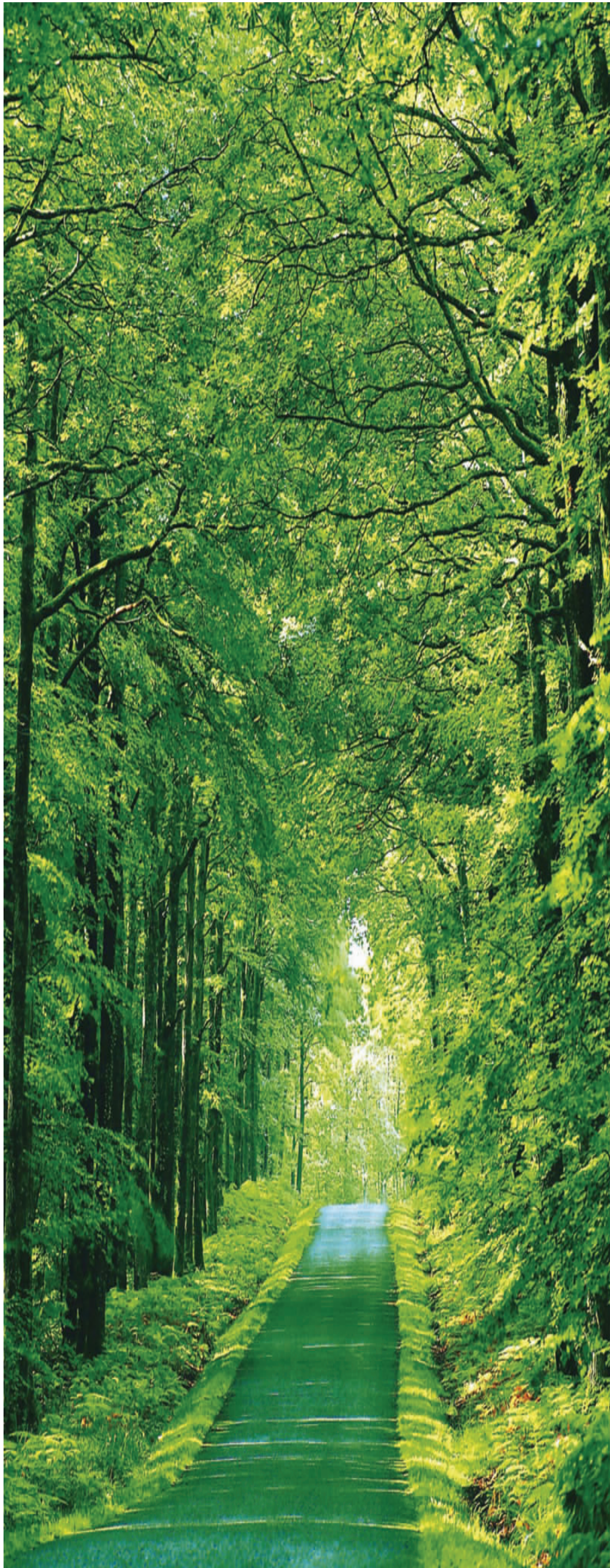
塞外“黄山”大美马鞍