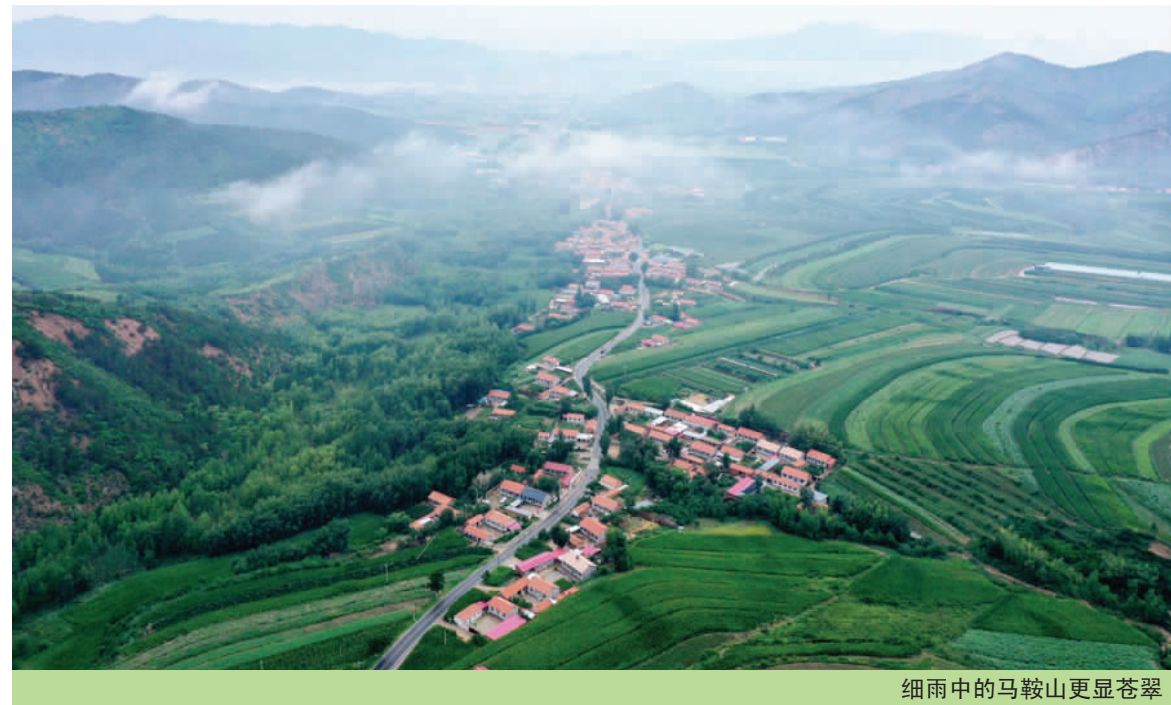
细雨中的马鞍山更显苍翠