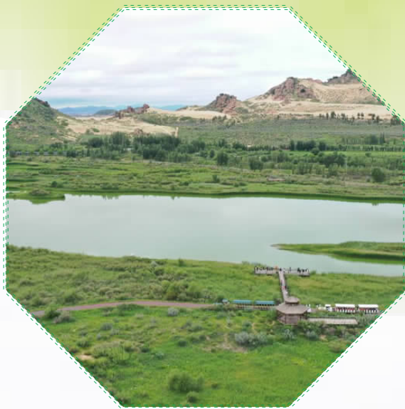
空中俯瞰玉龙沙湖

玉龙沙湖不仅是自然与历史的完美融合,更是翁牛特旗乃至内蒙古旅游发展的重要窗口其独特的地理位置和丰富的文化内涵,让这里成为自治区“全域旅游、四季旅游”战略部署下的璀璨明珠。