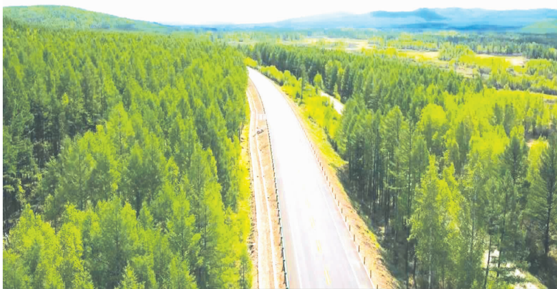
96332 库(布春林场)根(河)段

本报讯(记者 迪威娜)日前,G332 库(布春林场)根(河)段一级公路(以下简称“库根项目”)主线工程顺利通过交工验收,预计 8 月中旬通车试运营。