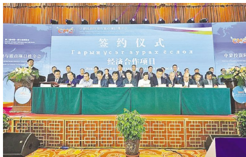
第二届中蒙博览会——中蒙投资环境与重点项目推介会上签约

时光流转,10年耕耘结硕果;盛会如约,中蒙携手再出发。2025年8月25日,呼和浩特迎来第五届中国—蒙古国博览会(以下简称中蒙博览会),恰逢中蒙博览会创办十周年与中蒙建交76周年的双重历史节点。这场以“深化互利合作,推进合作共赢”为主题的国际盛会,既是对过往10年合作成果的回望,更是开启未来共赢新局的序章。