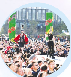
首届中蒙博览会开馆仪式中,蒙古族服饰展吸引众多观众