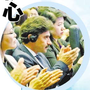
首届中蒙博览会上,代表们在为协议的成功签订鼓掌祝贺