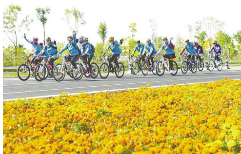
第二届中蒙博览会,中蒙俄三国骑手齐聚,绽放友谊之花