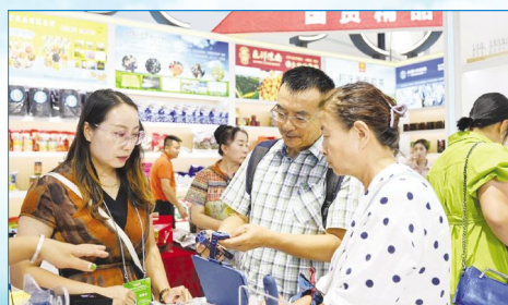
第四届中蒙博览会,市民选购商品