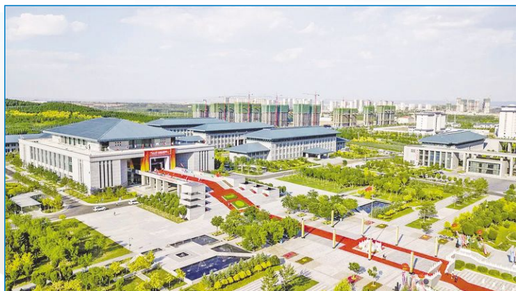
第三届中国—蒙古国博览会开幕式在乌兰察布市会议中心举行