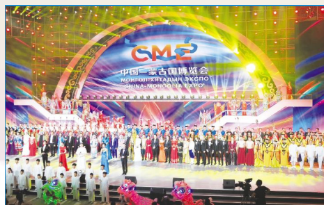
第三届中国—蒙古国博览会活动现场