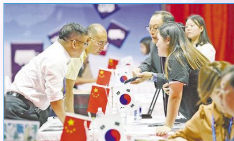
第三届中国—蒙古国博览会上,中韩企业代表在中韩企业经贸洽谈会上一对一洽谈