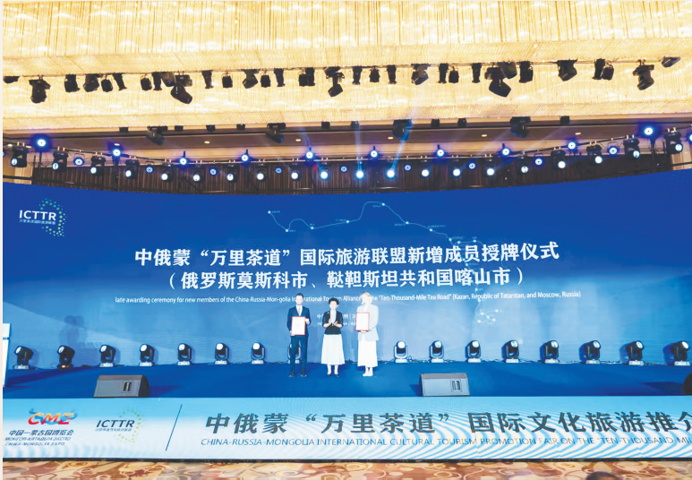
为新增成员单位授牌

联盟成立初由中方8省区、俄方3个地区、蒙方1省共12个文旅部门组成,经过9年的发展,扩展成为中方9省区、俄方10家、蒙方7省共26个文旅部门。联盟成员单位在《章程》的指导下“联动合作,互惠共赢,走向世界”,成员单位达成《中俄蒙“万里茶道”国际旅游联盟北京共同行动宣言》等多项合作意向,共同推出“万里茶道·相识之旅、商帮古风之旅、蓝色蒙古高原之旅、三湖之旅”等多项宣传推广活动,“满洲里—西伯利亚号”“呼和浩特—伊尔库茨克”等旅游专列旅游包机等跨境旅游产品。